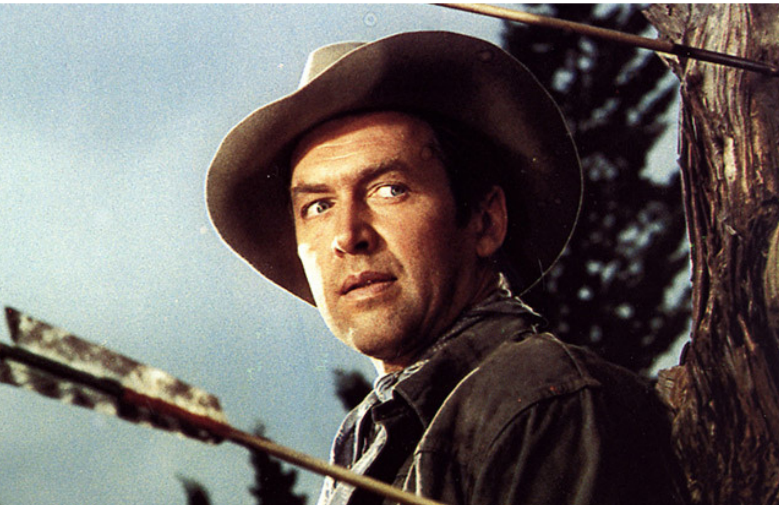
PHOTO : LA FLÈCHE BRISÉE, DELMER DAVES