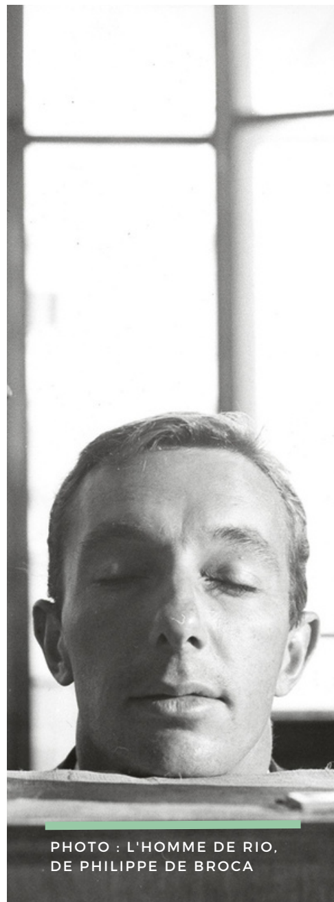
PHOTO : L'HOMME DE RIO, DE PHILIPPE DE BROCA